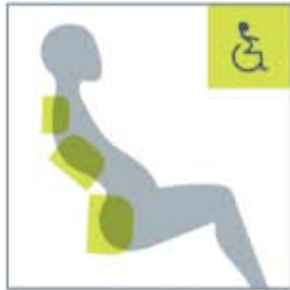
Anpassung des Wirbelsäulenprofils Beckenklippung nach vorne