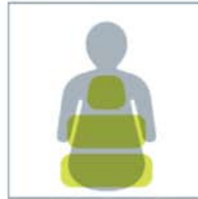
Passt sich komplexen Profilen an — Rumpfform