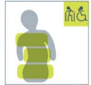
Passt sich komplexen Profilen an — Skoliose