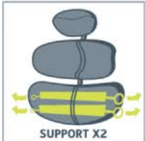
Axxis-Segmente können mit unseren einteiligen Rückenlehnen kombiniert werden