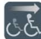
Einstellung zur Größenanpassung