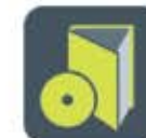
Literatur & Trainings-DVD